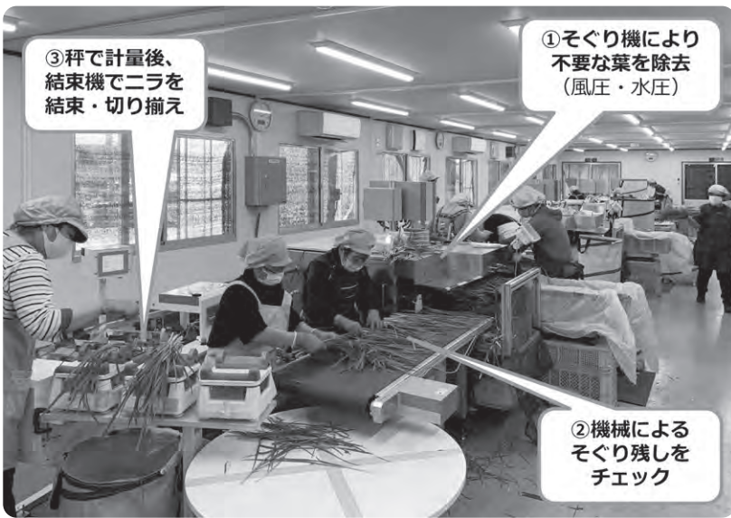
そぐり設備と作業の概要

②計量装置、③結束機から成っており、現在四ライオンを保有しています。そぐり機とは、水と風圧でニラの外側にある古い葉や枯れた葉などを除去する機械です。そぐり機で不要葉を除去し、一〇〇g/束に計量した後、結束機で農家が印字されたテープで結束しており、ニラの状態に合わせて三〜四人／ラインで作業を行います。