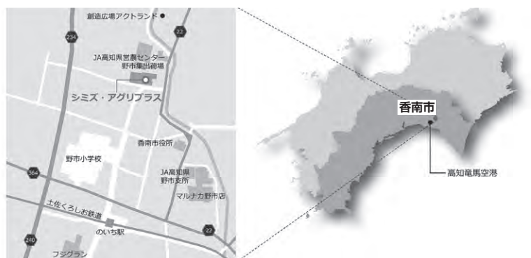
シミズ・アグリプラス所在地

当社は、二〇一六年頃より農林中央金庫と共同で、全国の農業における地域課題を抽出し、農産物生産地として特に高いブランド力を誇る高知県を題材に事業の調査・スタディを開始しました。