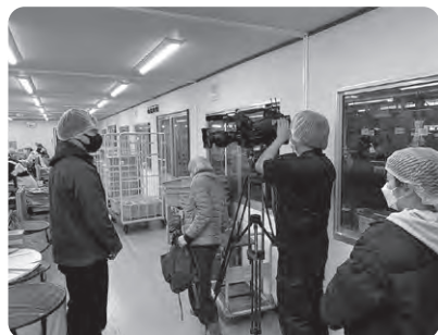
テレビ取材/社会科見学の様子

地域では二ら以外の作物でも労働力不足に悩む同様の課題が山積んでいます。現在、県の農業振興部やJA等と課題の抽出を行いながら、様々な品目について地域との新たな協業可能性について検討を進めています。また膨大な農業残渣の処理も問題となっており、高知県内でも農業残渣の処理や有効活用を考える必要があります。高知県にとどまらず、様々な地域と