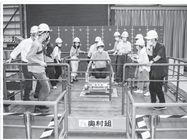
耐震実験棟で阪神・淡路大震災等の地震の揺れを体験

参加した学生からは、ゼネコンの仕事の幅広さや農林水産行政の内容を知ることができ、将来の進路選択に大変役に立つ見学会であったとの感想が寄せられました。