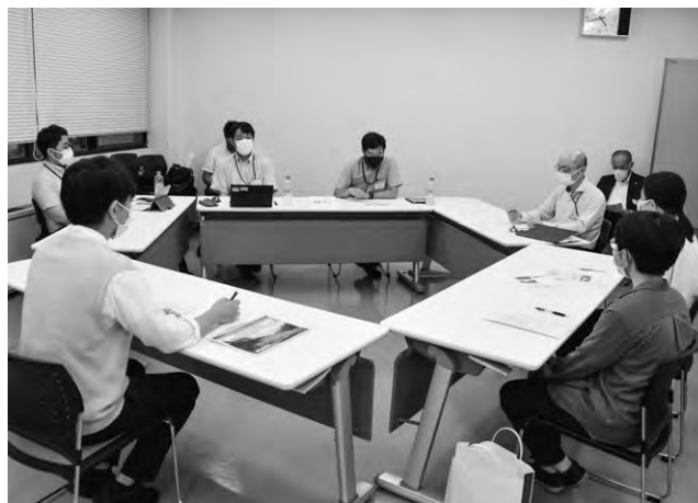
安藤ハザマブースでの意見交換