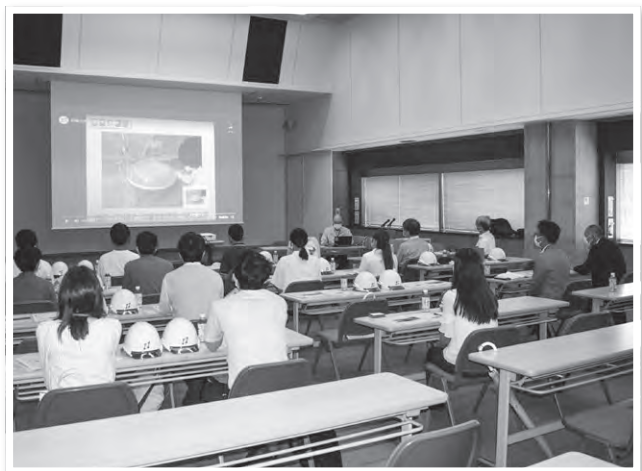
安藤ハザマ 本館講堂での全体説明