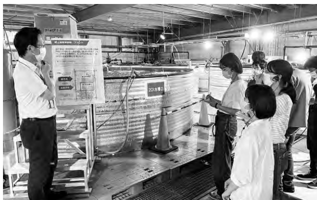
奥村組 ふく養殖の実証実験