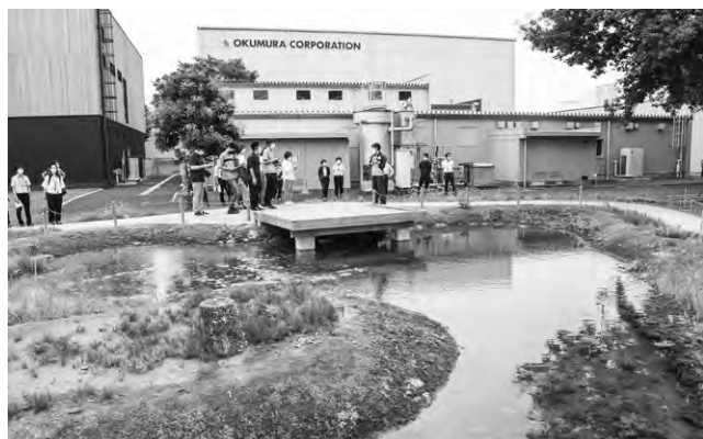
奥村組 ビオトープ

しかし、進路が確定したわけではないのですが、今回の研究所見学で探求する仕事がとてもかっこいいと感じました。このような長期休みを活用しいろんな体験を通して何が自分のしたいことなのか探していきたいと感じました。