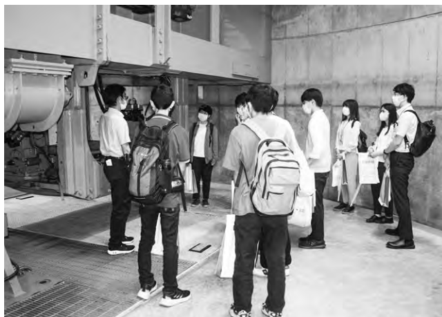
農研機構 遠心載荷実験装置

そして何より、自分の好きな研究を仕事にするやりがいや、自分の作ったものをみんなに利用してもらい、喜んでもらうという仕事のロマンについて実際にその仕事についている方々の言葉を聞くことで、自分の将来像を想像していくうえでとても良い影響になったと思います。